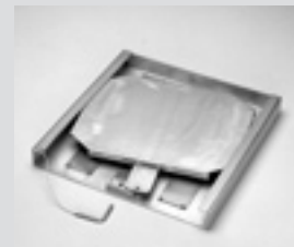
Schiebeuntersatz kurz. Short sliding plates.