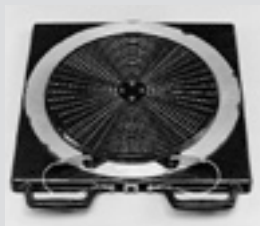
Alu-Drehuntersatz, elektronisch. Aluminium turntable, electronic.