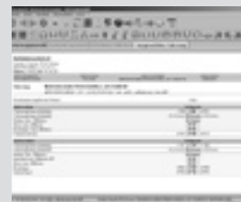
Mercedes-Benz Werksdatensatz mit Messroutine. Mercedes-Benz manufacturer target dataset with measurement routine.