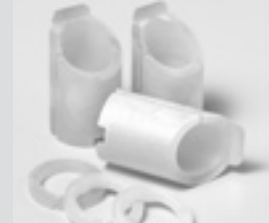
Kunststoffhülsen für Softlinefelgen. Plastic rim protectors for soft line rims.