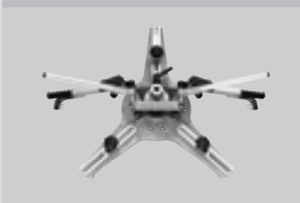
Multi-Quickspanner, für alle Felgen von 13" bis 24". Multi Quick Clamp, suitable for all rims from 13" to 24" diameter.