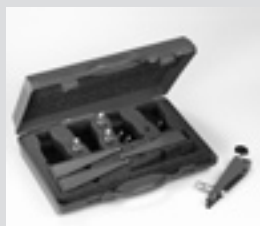
Präzisions-Spoileradapter. Precision spoiler adapter.