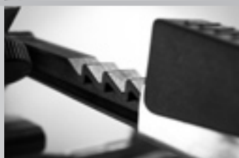
Kunststoffzahnstange zur schnellen und einfachen Bedienung. Plastic rack with spring claw for quick and easy clamping.