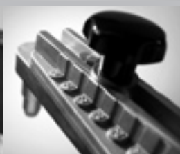
Drei Alu-Kunststoffabstandsbolzen einstellbar zur Zentrierung. Three alloy plastic spacers adjustable for correct centering.