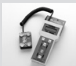
Romess-Neigungsmessgerät. Romess inclinometer.