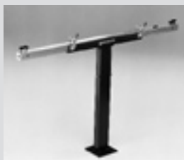
Kalibriervorrichtung. Calibration device.