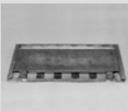
Schiebeuntersatz lang. Long sliding plates.