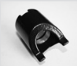
Spannhülsen-Set aus Alu, zwölf Stück. Clamping sleeve set of aluminium, 12 pieces.