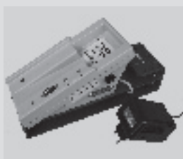
Romess-Ladestation. Romess charge-unit.