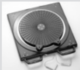
Drehuntersatz mechanisch. Turntable, mechanical.